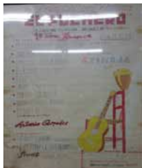
Fig. 21. Cartel de 1988 Peña Flamenca El Puchero