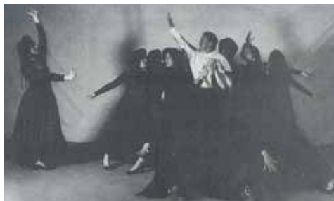
Fig. 19. Carmen , 1993.

(1982). Inició sus estudios de danza en el Centro de Estudios Coreográficos Los Germanos en Dos Hermanas, donde cursó seis años de danza en la modalidad de clásico español y escuela bolera. Realizó su incursión en el flamenco con dos cursos académicos. Le siguieron innumerables cursos, estudios, flamencos en sus distintos palos en Córdoba, Sevilla, Linares, Úbeda. Inició su andadura profesional como docente durante dos años en el taller de Danza del Colegio Sagrado Corazón de Bailén, en 1977. De 1992 es su primer montaje de danza-teatro, con Bodas de Sangre , de Lorca, al que siguieron Carmen de Bizet y Merimée (1993), Quejío y Llanto (1994), Las mujeres de Lorca (1995), escenificado a lo largo de la geografía andaluza. Desde enero de 2006 fue presidenta de la Asociación Provincial de Profesionales y Amigos de la Danza Todo Danza de Jaén .