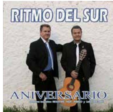
Fig. 17. Portada de disco de Ritmo del Sur.