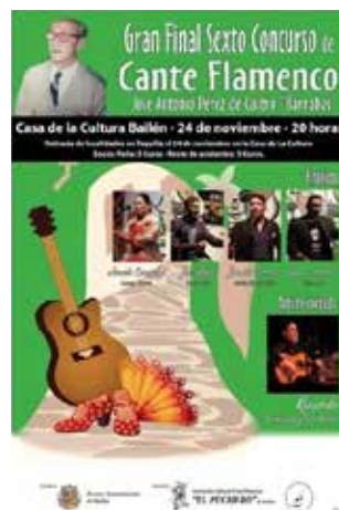
Fig. 22. VI edición del «Concurso de Cante Flamenco José Antonio Pérez de Castro, Barrabás», 2018.