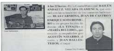
Fig. 14. Programa de Fiestas de 1997.