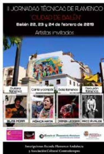
Fig. 1. Carteles publicitarios de las I y II Jornadas Técnicas de Flamenco «Ciudad de Bailén».