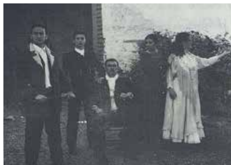
Fig. 20. Quejío y llanto , 1994.