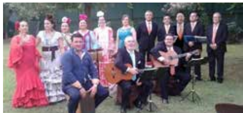
Fig. 18. Coro Romero Mejorana.

78. Coro Romero Mejorana (Bailén, 1995). Es el grupo pionero de la música romera por sevillanas y rumbas flamencas en nuestra localidad, participando en numerosos actos, actividades y misas romeras, mostrando su buen hacer y profesionalidad en nuestra ciudad y allá por donde va. Fue Premio Caecilia «A la Creación Musical» 2004. Ya aparecen en los Programas de Fiestas de 1997 («coro rociero») y 1998 («Noche rociera»).